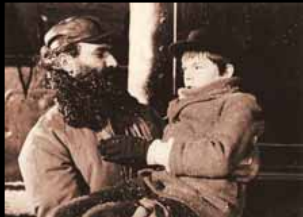
»Vlak u snijegu« Mate Relje (1976.)