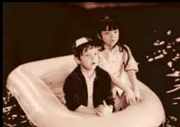
»Sedmi kontinent« Dušana Vukotića (1966.)