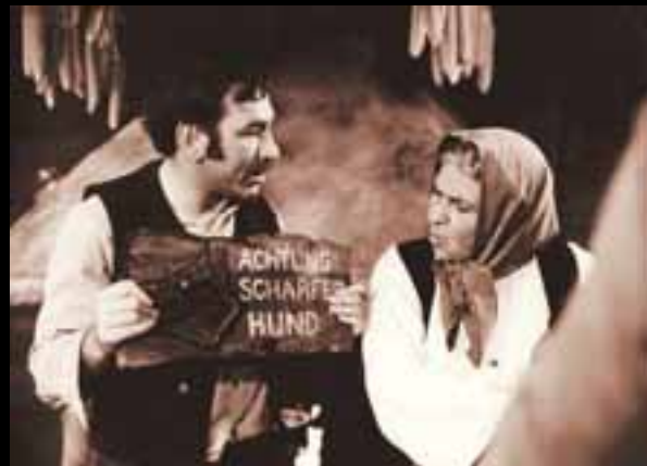
»Vuk samotnjak« Obrada Gluščevića (1972.)