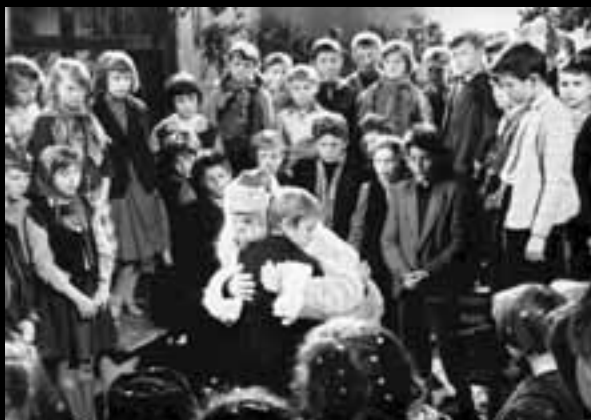
»Izgubljena olovka« Fedora Škubonje (1960.)